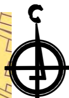
Рассматриваемый земельный участок 23:08:0102173:19